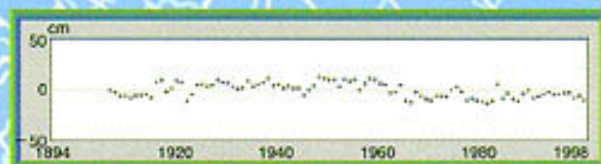
OSHORO / 年平均潮位の変化