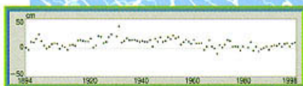
WAJIMA / 年平均潮位の変化